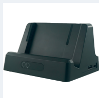
Culla di ricarica